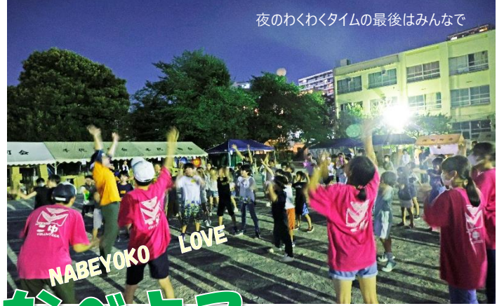
夜のわくわくタイムの最後はみんなで