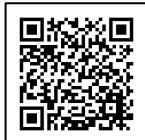
中野区 HP ペットの災害対策

自宅での生活が困難な場合ペットはどうしたらいいでしょう？「中野区地域防災計画」では、ペット（小動物）の同行避難を受け入れ、校庭等の一部スペースをペットの避難所として確保することを定めています。