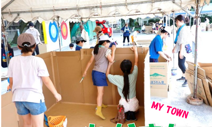
ダンボールハウス作成中!