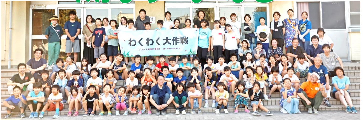
「わくわく大作戦」左側のQRコード(鍋横チャンネル)から当日の様子を配信しています