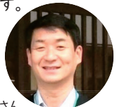
條さん(管理者・社会福祉士)